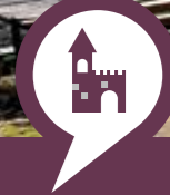
Heinz M. Müller, „Neef im Ojektiv“, www.moselbild.de